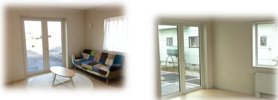
* 外観パース・写真はイメージです